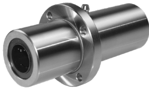
Mittenflansch-Dreifach-Kugelbuchsen Ball Bushings center flanged triple wide